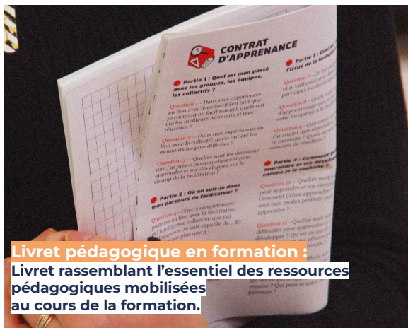
Livret pédagogique en formation : Livret rassemblant l'essentiel des ressources pédagogiques mobilisées au cours de la formation.

Les ressources sont en libre accès sur notre site, et régulièrement mises à jour.