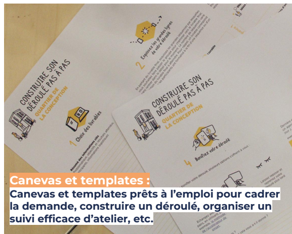
Canevas et templates : Canevas et templates prêts à l'emploi pour cadrer la demande, construire un déroulé, organiser un suivi efficace d'atelier, etc.