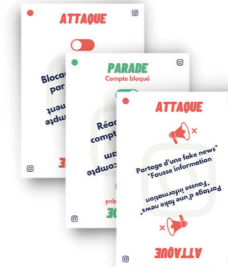
Pile de bataille