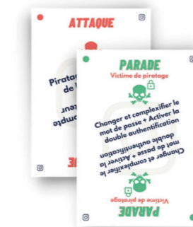
Pile cyberattaque : ralentissement